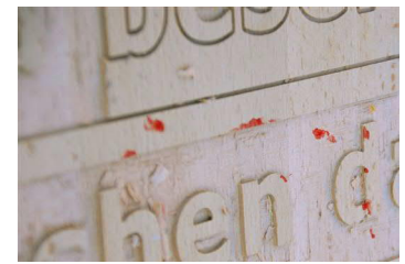
sich selbst (Verräterische Blutsprengen)