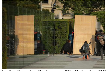
Aufstellen der Stele zum 70. Geb. des GG