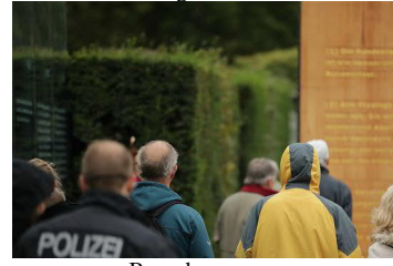
Besucher am ...