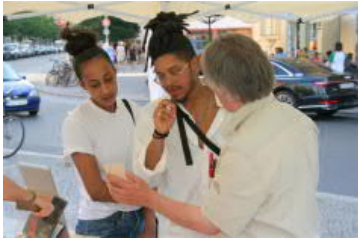
Gespräche, Gespräche, Gespräche