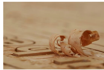
das Holz ... teils trifft man ...