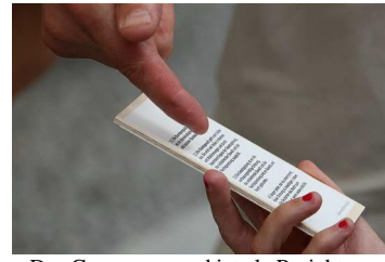
Das Ganze war und ist als Projekt ...