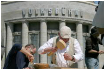
Teils trifft man ...