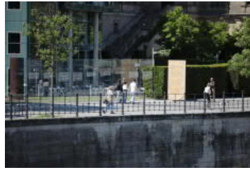
Artikel 20 GG: Die große Gefahr...