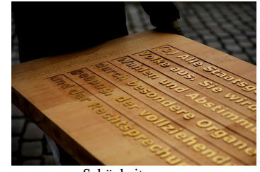
Schönheit pur ...