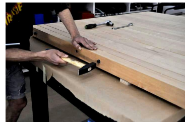
Zimmern der Stele