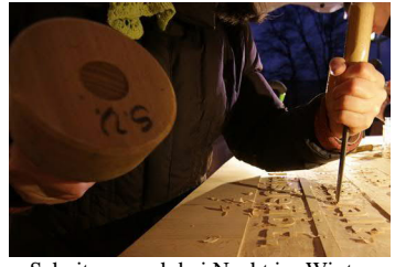
Schnitzen auch bei Nacht im Winter