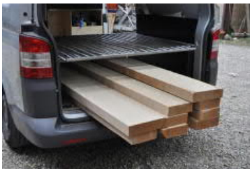
Besorgen des Holzes ...