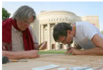
zur Eröffnung des 70sten Jahres des GG