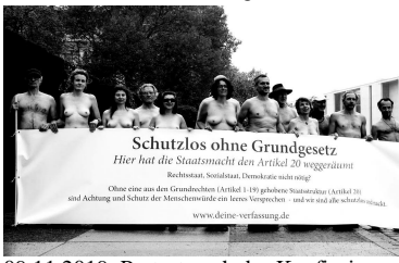
09.11.2019: Protest nach der Konfiszierung