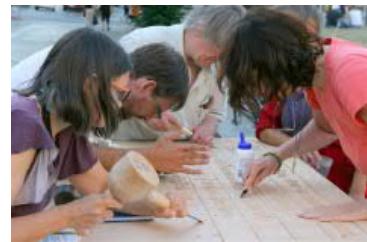
an der Volksbühne