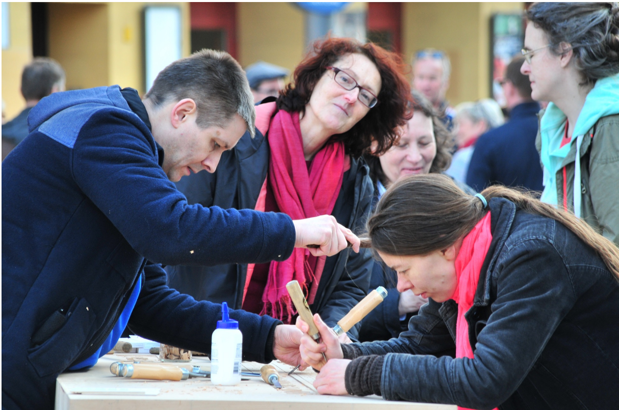
Schnitzen am Rosa-Luxemburg Platz Berlin