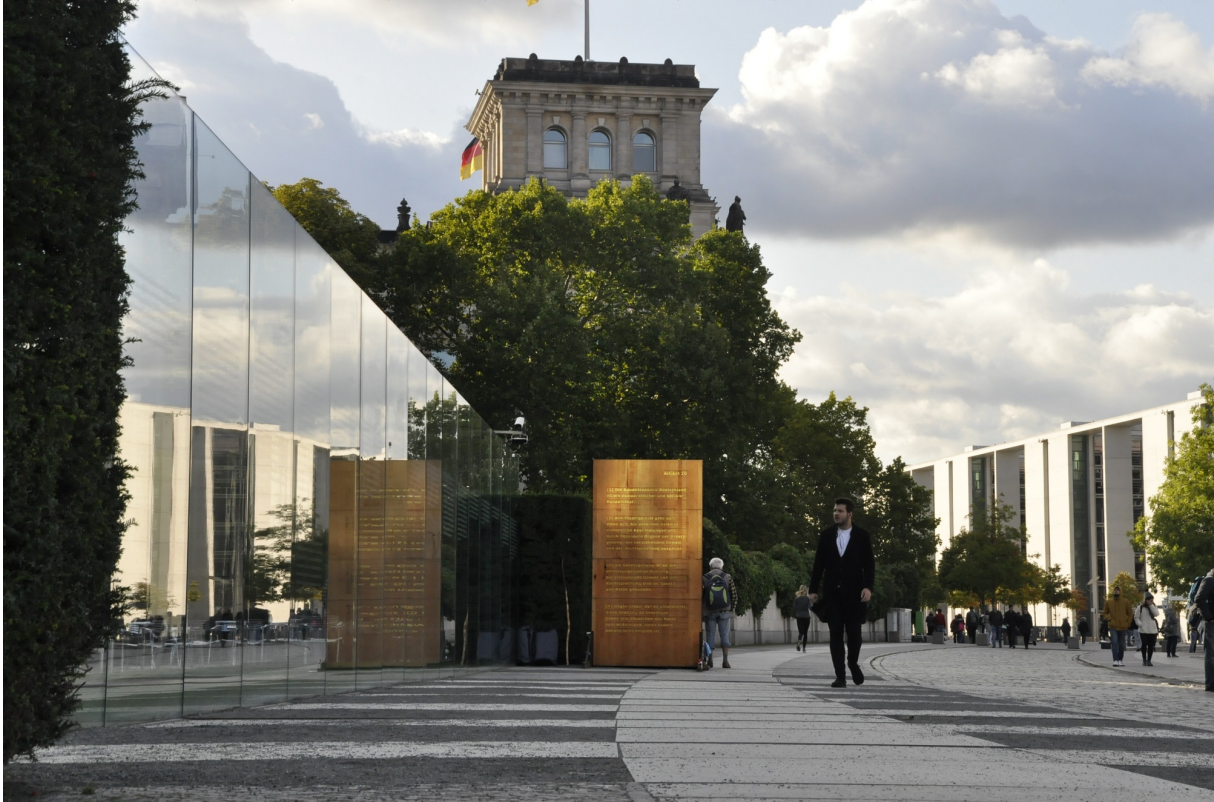
"Gefährdung der öffentlichen Ordnung": Artikel 20 GG in Gold auf Buche