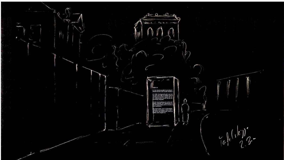
Die Glassäule Artikel 20 GG am Stelenkunstwerk Dani Karavans

Von hinten sieht man durch den spiegelbildlich erscheinenden Text in die Welt (das ist hier das Panorama Berlins mit der Spree und dem Bahnhof Friedrichstraße), die durch die Beachtung der Prinzipien der Staatsstruktur ihr freiheitliches Gepräge erhält."