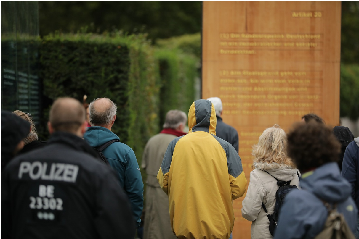
Die Stele am Bundestag