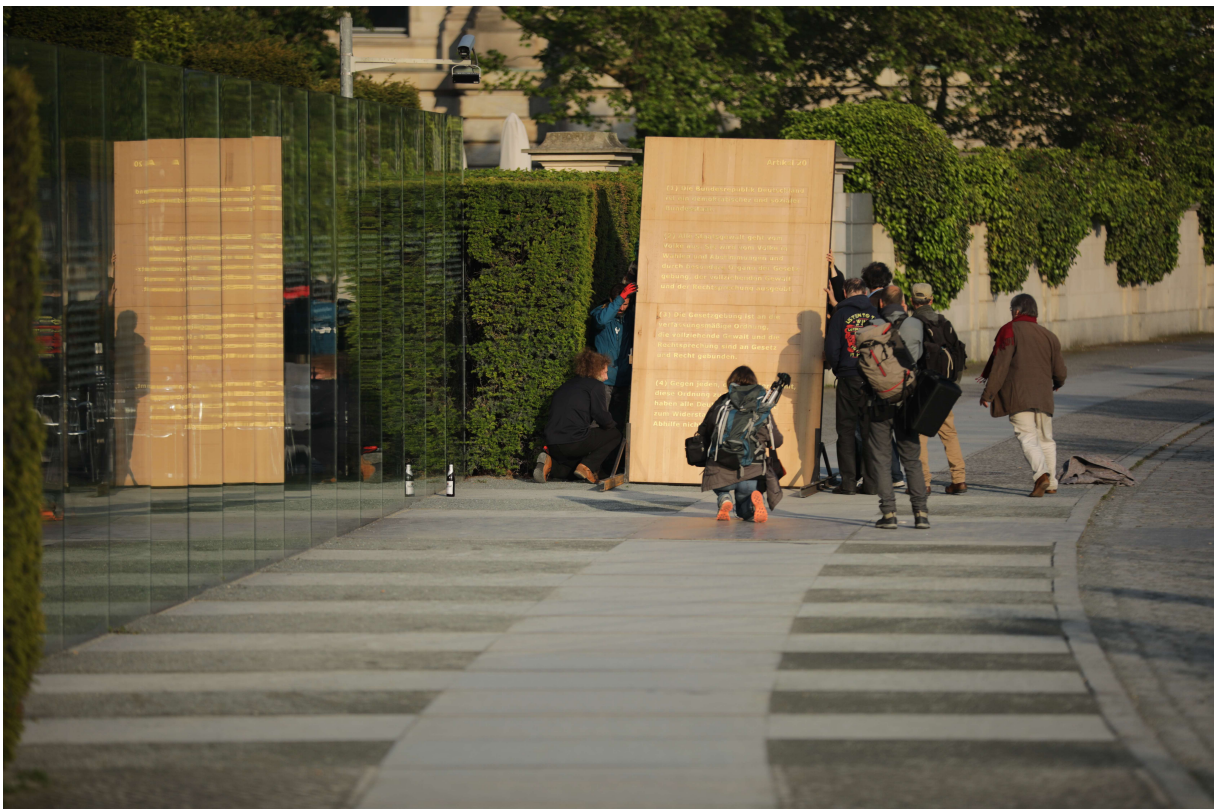
Aufrichtung der Stele zum 70. Geburtstag des Grundgesetzes an Karavans "Grundgesetz 49"