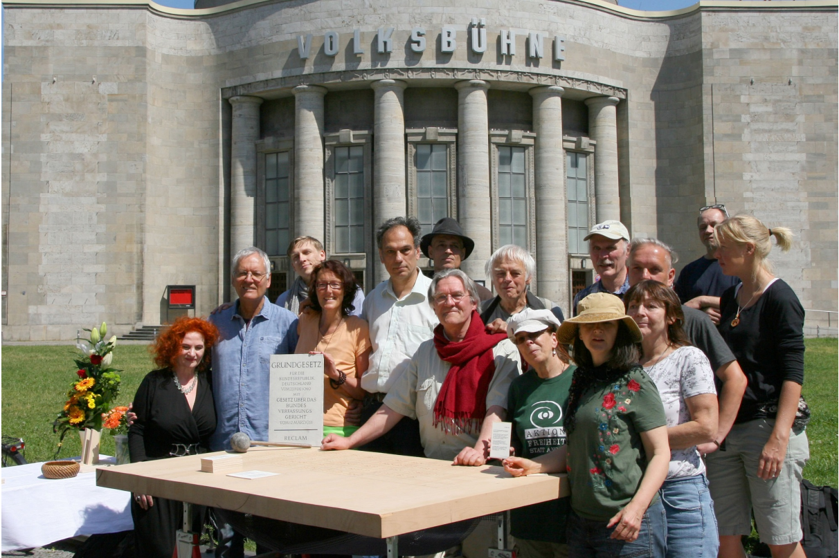
Beginn des Schnitzens am 25.05.2018 am Rosa-Luxemburg Platz, Berlin