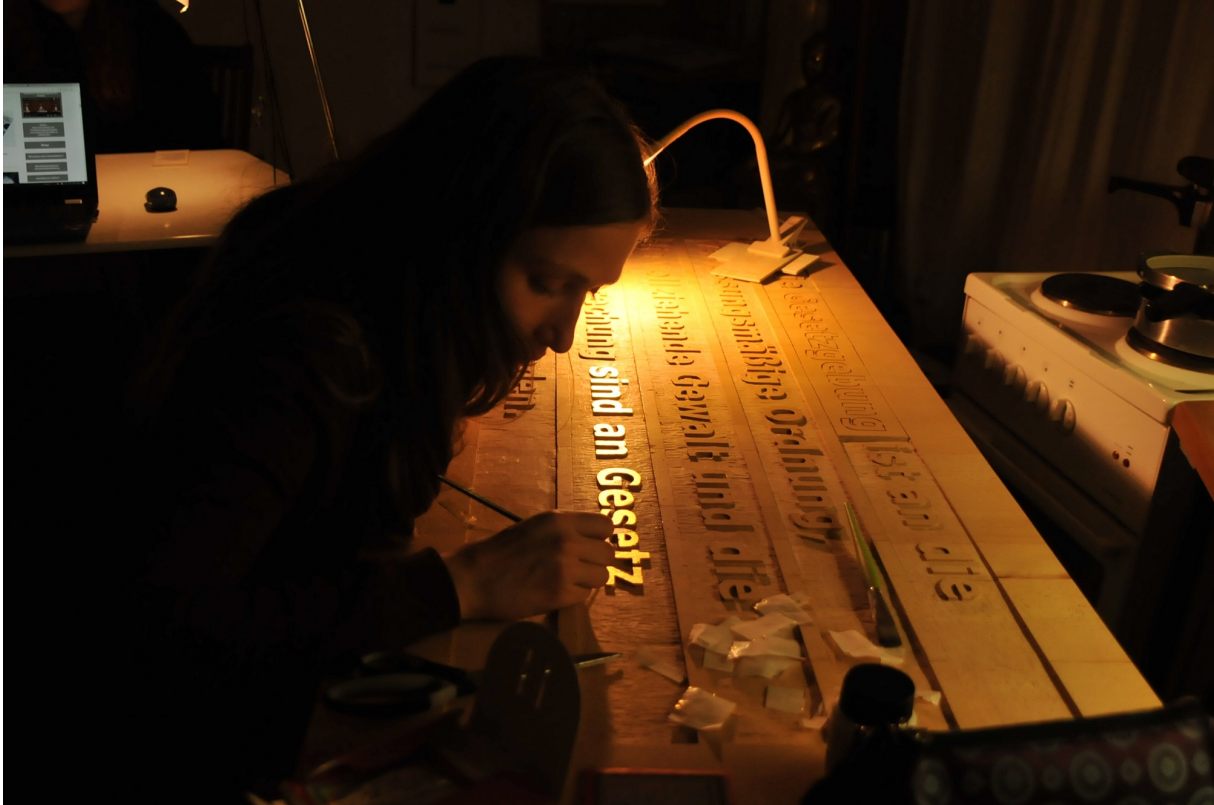
Vergolden des Textes der Stele