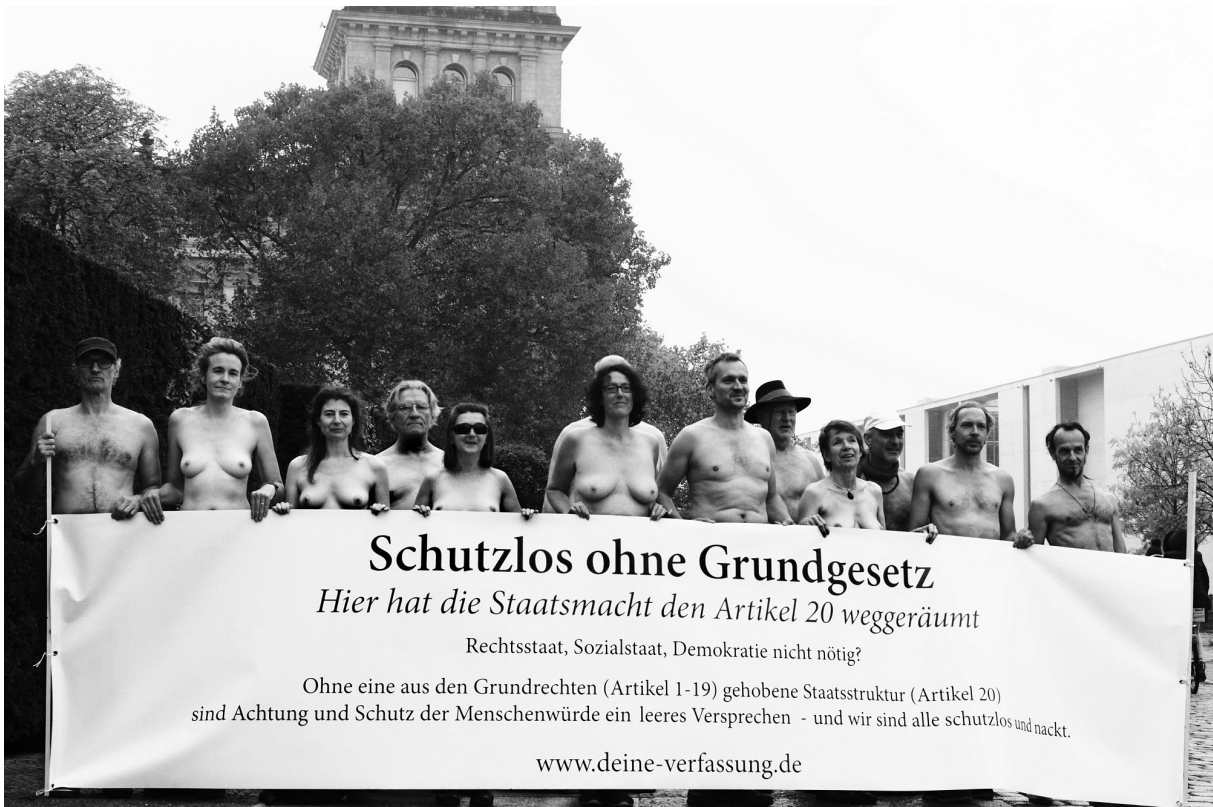
Protest nach Konfiszierung der Stele am 09.11.2019 am Bundestag