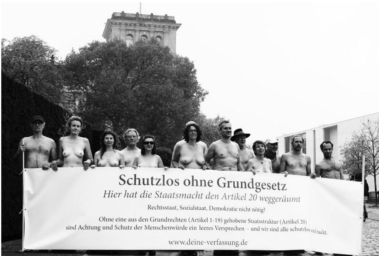
Unsere Antwort auf die Konfiszierung der Stele am 09.11.2019 http://akt3.deine-verfassung.de/